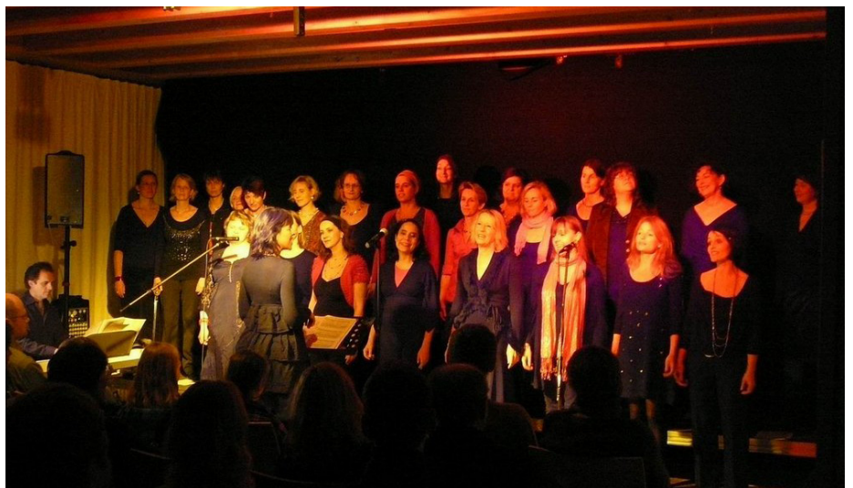
Der wunderbare Frauenchor auf Stuttgart sang über die „wahren Gefühle“ der Frauen