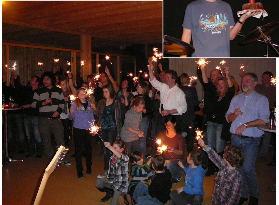
Bei volle Lotte rockt nicht nur das Haus. Nein, es gibt auch Geburtstagsständchen und Kuchen satt.

Freitagabend? Pardon – da haben wir schon was vor! ■